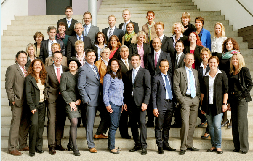
Die Versicherungsmakler 1918 Hilsenbeck sind heute mit rund 45 Beratern an sechs Standorten in Neuss, Krefeld, Düsseldorf, Tönisvorst, Willich und Oberhausen aktiv.